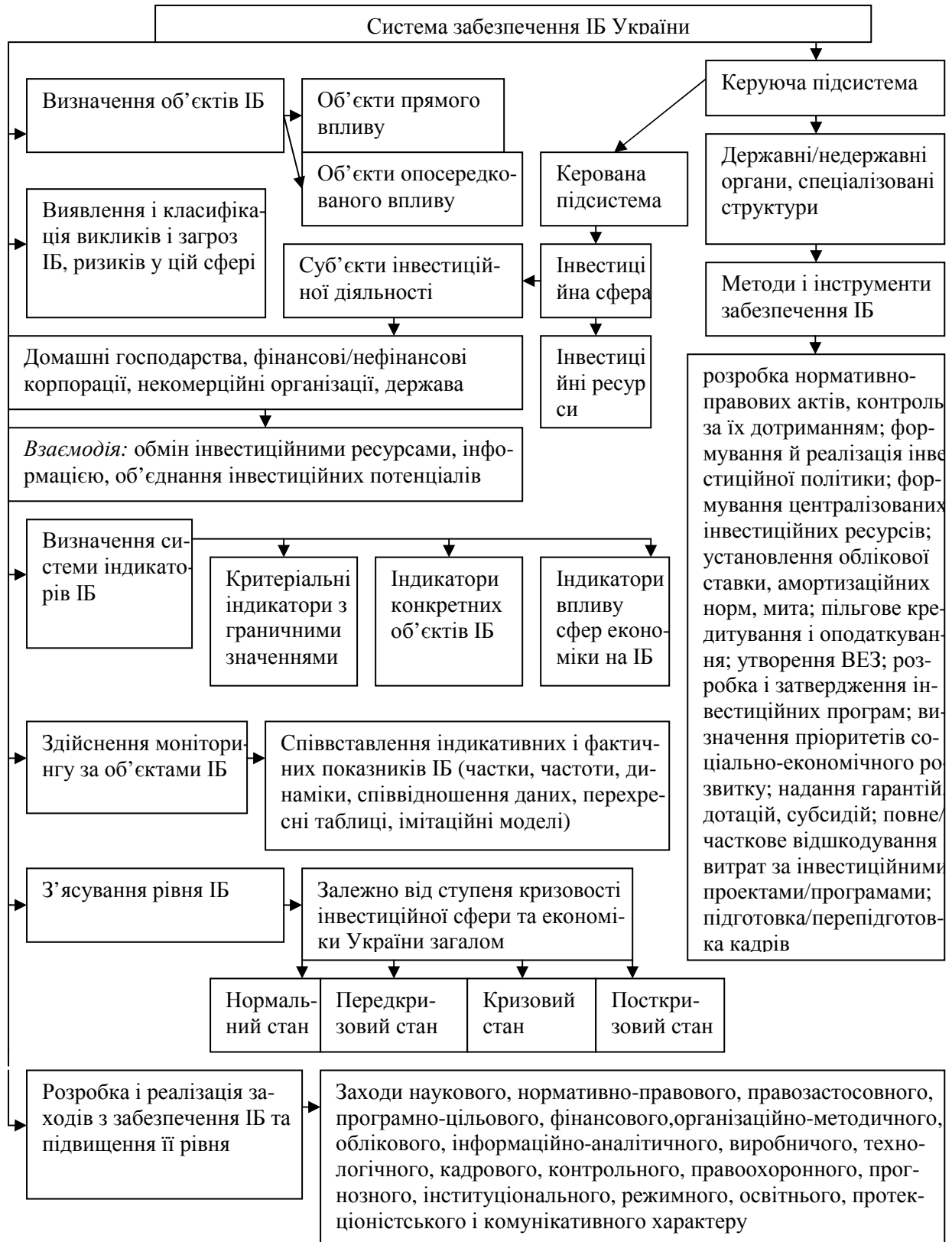
Рис. 2. Структурна модель системи забезпечення ІБ України

лише з різних ракурсів підводять відповідних розробників і всіх задіяних в ефективному функціонуванні такої системи державних органів, юридичних і фізичних осіб до врахування всіх її складових і компонентів для досягнення найкращих результатів, підвищення рівня ІБ України. У дисертації визначені зміст політики ІБ і алгоритм її комплексної оцінки.